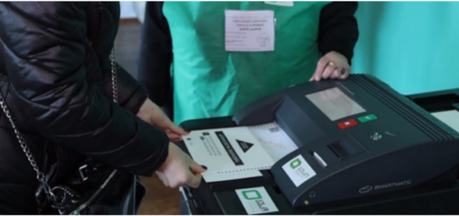
ხმის დამთვლელი აპარატი

დადებითად შევაფასებდი არჩევნების დღეს საარჩევნო უბნებში ამომრჩევლის რეგისტრაციისა და ხმების დათვლისათვის ელექტრონული სისტემის შემოღებას. ამ სისტემის პროგრამულ უზრუნველყოფას აკეთებს საერთაშორისო ორგანიზაცია, რომელმაც უზრუნველყო არაერთ სახელმწიფოში არჩევნების ელექტრონული წესით ჩატარება და აქვს დიდი ავტორიტეტი. არ მგონია, რომ მან შეადგინოს პროგრამა, რომლის მანიპულირება შეიძლება, რადგან ასე რომ მოიქცეს, ადრე თუ გვიან ეს „გასკდება“ და იგი დაკარგავს ავტორიტეტს, მას აღარავინ ენდობა და მიიღებს უზარმაზარ მატერიალურ ზარალს. ამიტომ, ნაკლებად მოსალოდნელია, რომ მოხდეს ამ სახის უკანონობა.